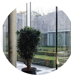
Tilburg University Gegründet 1927; > 20'000 Studenten