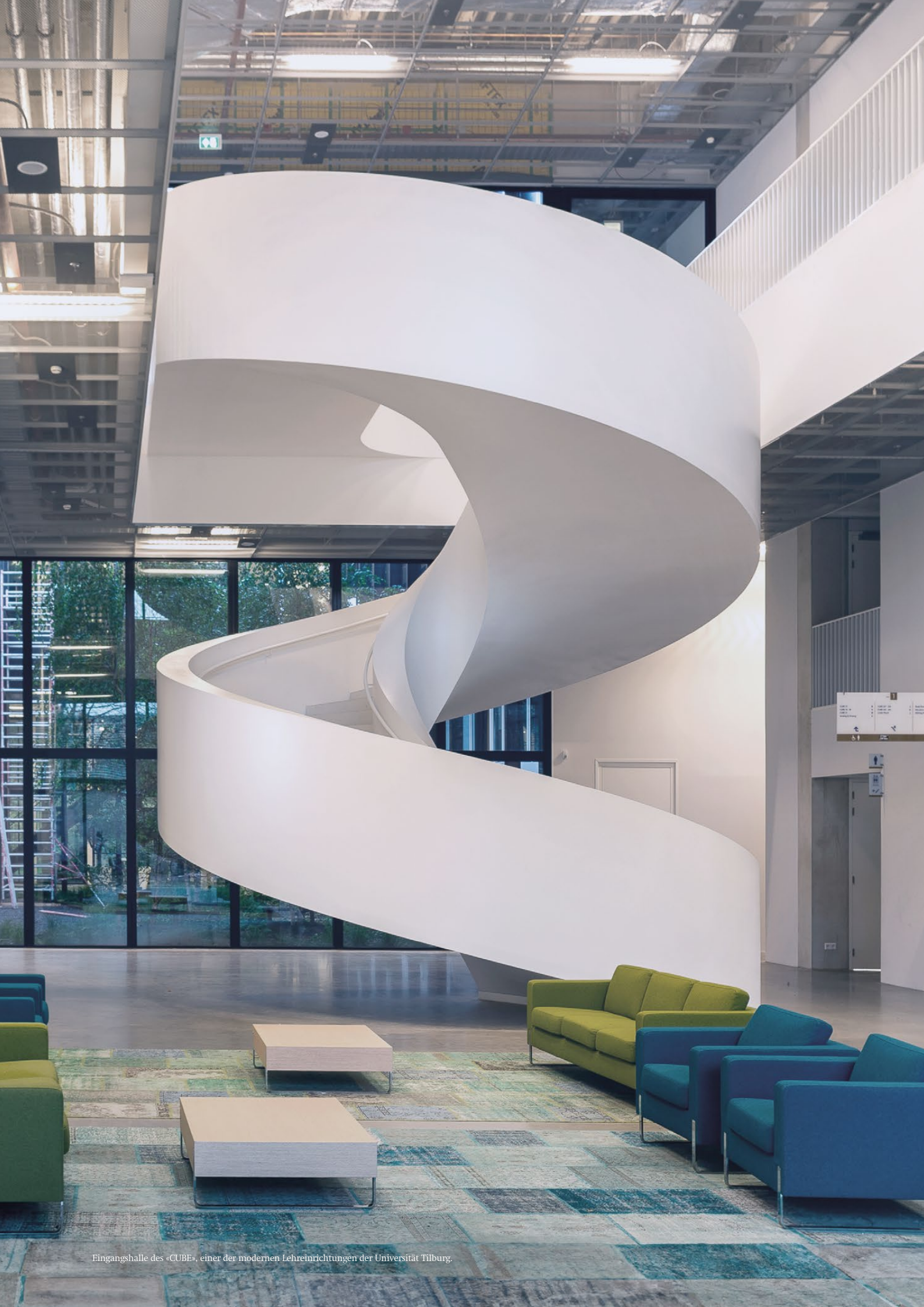
Eingangshalle des «CUBE», einer der modernen Lehrinrichtungen der Universität Tilburg.