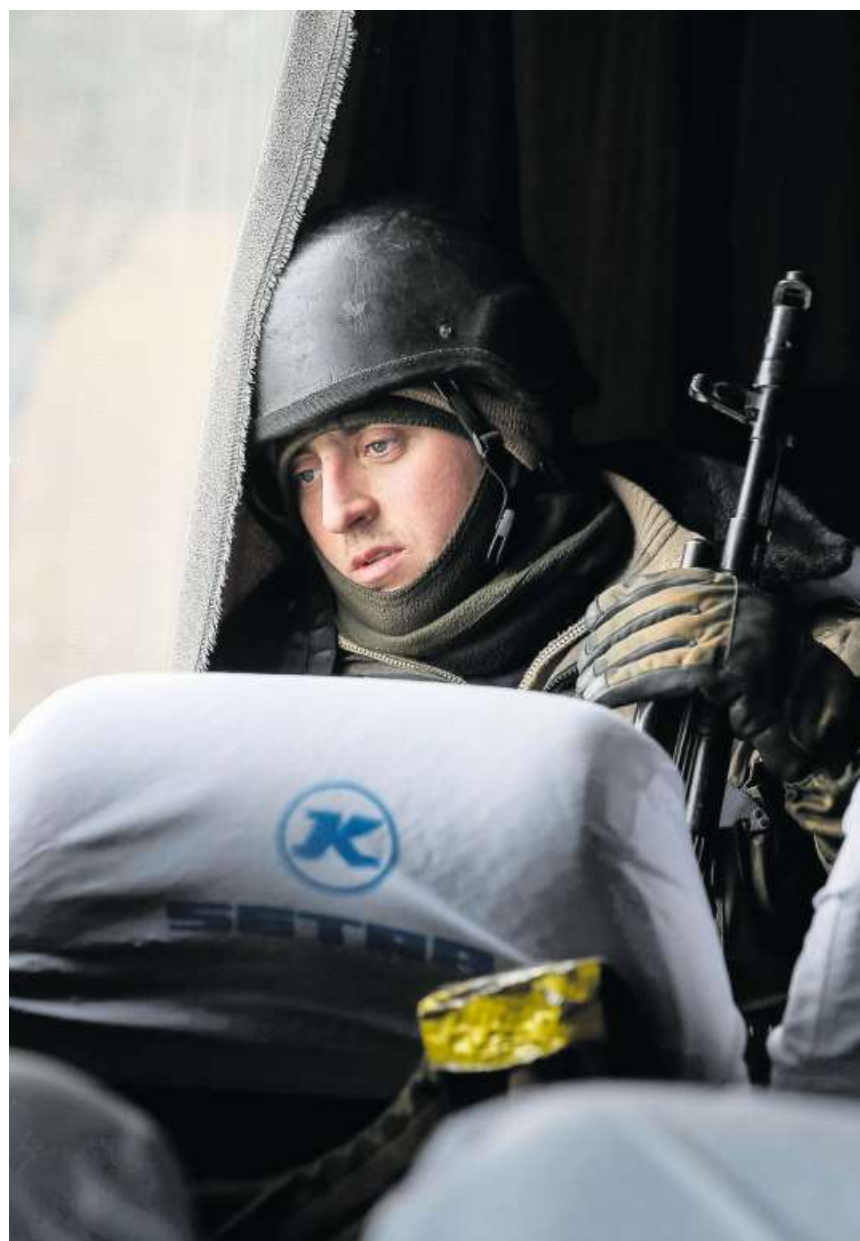
Strategische Ungewissheit prägt die Welt der Gegenwart.