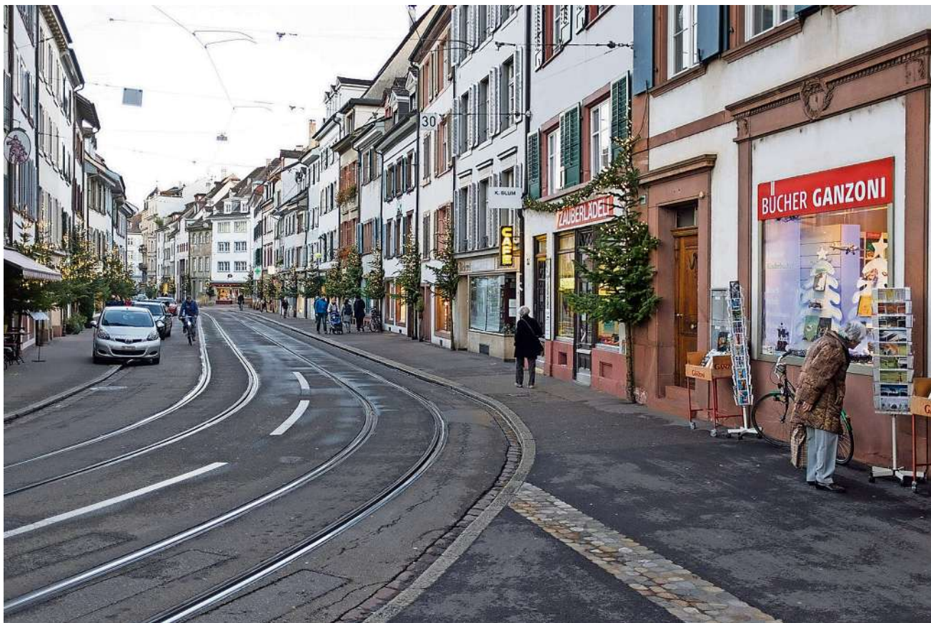
Gemütliches Ambiente. Die Buchhandlung Ganzoni ist der ideale Ort für anregende Gespräche

WWZ Auditorium der Universität , Basel, Peter Merian-Weg 6, 17.30–19.30 Uhr www.wwz.unibas.ch