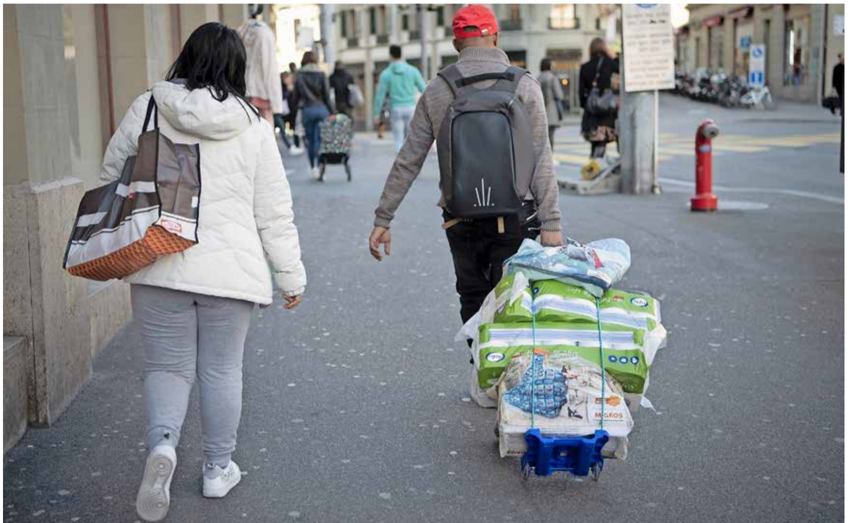
Hamstern sei in den Menschen verankert, sagt der Verhaltensökonom Bruno S. Frey. Für einzelne könne es durchaus sinnvoll sein.

Das Tessin will mit einer weitgehenden Stilllegung der Industrie die Ausbreitung des Coronavirus verlangsamen. Die Zahl der Infizierten ist nirgends in der Schweiz so hoch. Macht das Sinn?