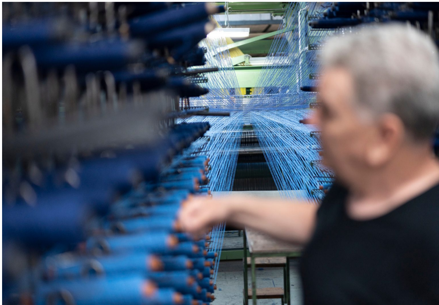
Ältere Arbeitnehmende verlieren seit letztem Herbst häufiger den Job: Angestellter in der Textilfabrik Tisca in Bühler AR.

Nachdem ausserdem im vergangenen Frühsommer tatsächlich vor allem Jüngere ihren Arbeitsplatz eingebüsst hatten, traf