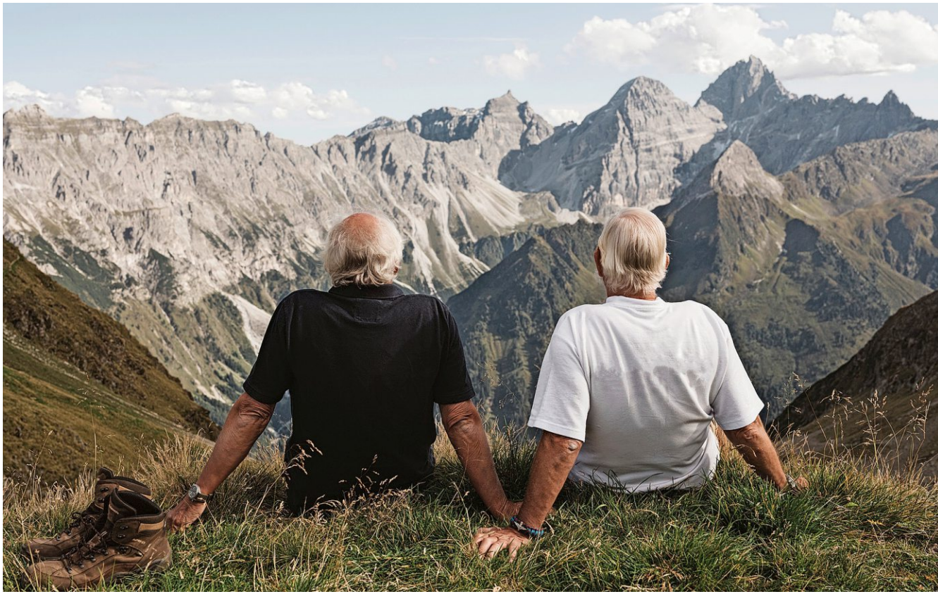
Das Vorsorgevermögen für Pensionäre ist auf lange Sicht angelegt, mit Derivaten lassen sich Risiko und Rendite optimieren.