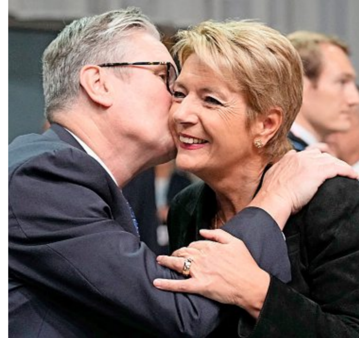
Kann die Schweiz von Grossbritannien lernen? Bundesrätin Karin Keller-Sutter trifft den britischen Premierminister Keir Starmer.

Unsicherheiten bringt», sagt FDP-Ständerat Andrea Caroni. «Es kommen nicht automatisch weniger oder geeigneterer Personen.» Klar sei nur eines: «Es würde massiv komplizierter, die gesuchten Fachkräfte aus den EU-Staaten bei uns zu engagieren.»