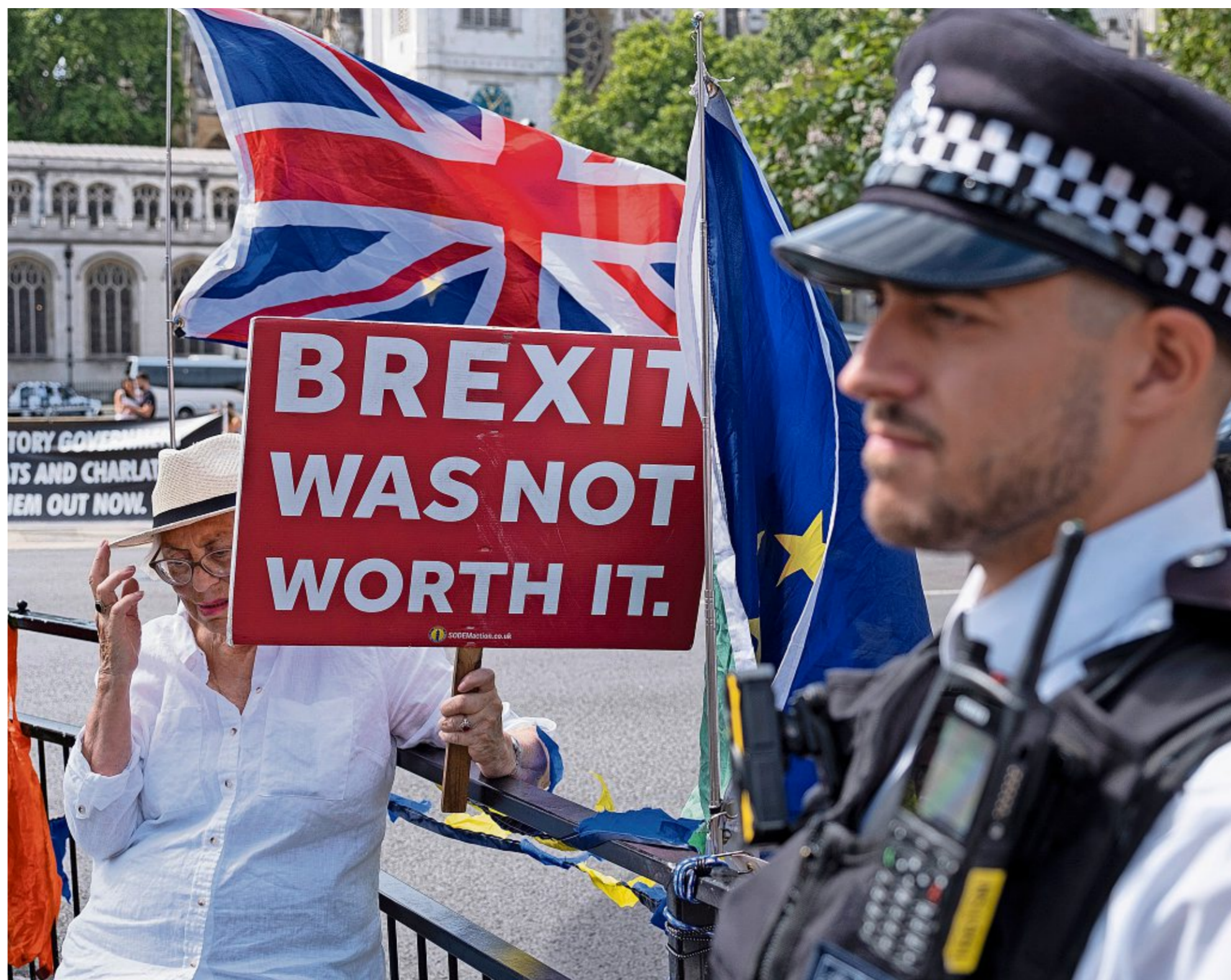
Grossbritannien kämpft bis heute mit den Folgen des EU-Austritts. Für diese Demonstrantin in London ist klar: «Der Brexit war es nicht wert.» (2022)

Die Zahl der Asylgesuche stieg nach dem Brexit ebenfalls stark an. 2024 gab es einen neuen Rekord mit 104'000 Anträgen. Im letzten Jahr waren es nur leicht weniger. Selbst während der Flüchtlingswelle vor einem Jahrzehnt zählte das Land jährlich nur rund 30'000 Gesuche.