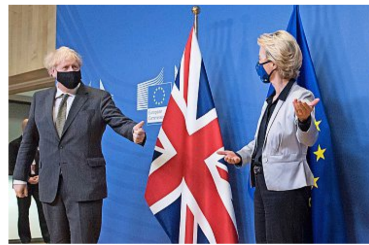
2020 einigten sich EU-Kommissionspräsidentin von der Leyen und der damalige Premier Johnson auf ein Brexit-Handelsabkommen.