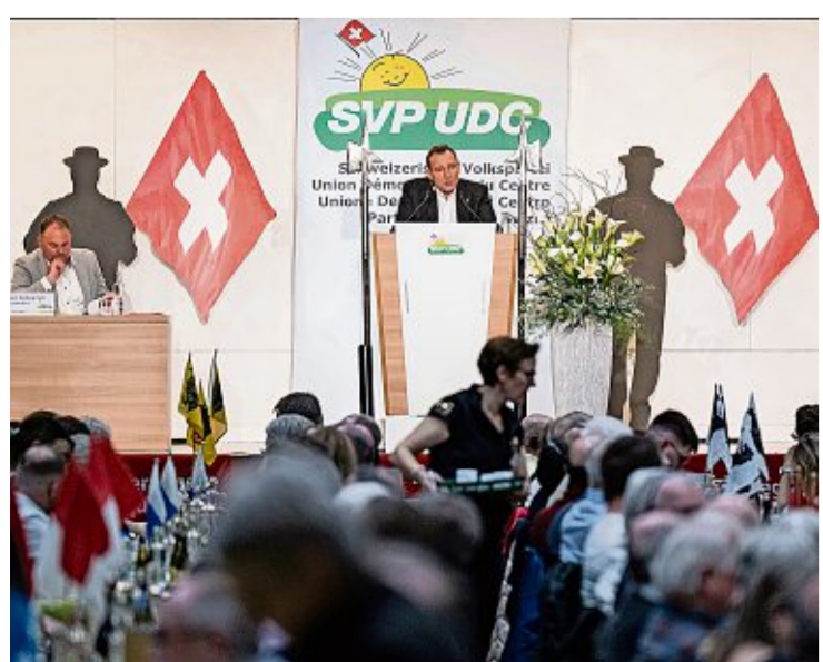
Der Zürcher SVP-Nationalrat Thomas Matter machte gestern Stimmung für die SVP-Initiative.

Laut Matter kann die SVP-Initiative nicht mit dem Brexit verglichen. Im Gegensatz zu Grossbritannien sei die Schweiz nie EU-Mitglied gewesen und müsse auch nicht Tausende Verträge auflösen. Die Schwierigkeiten der Briten bei der Zuwanderung bezeichnet er als «innenpolitisches Problem».