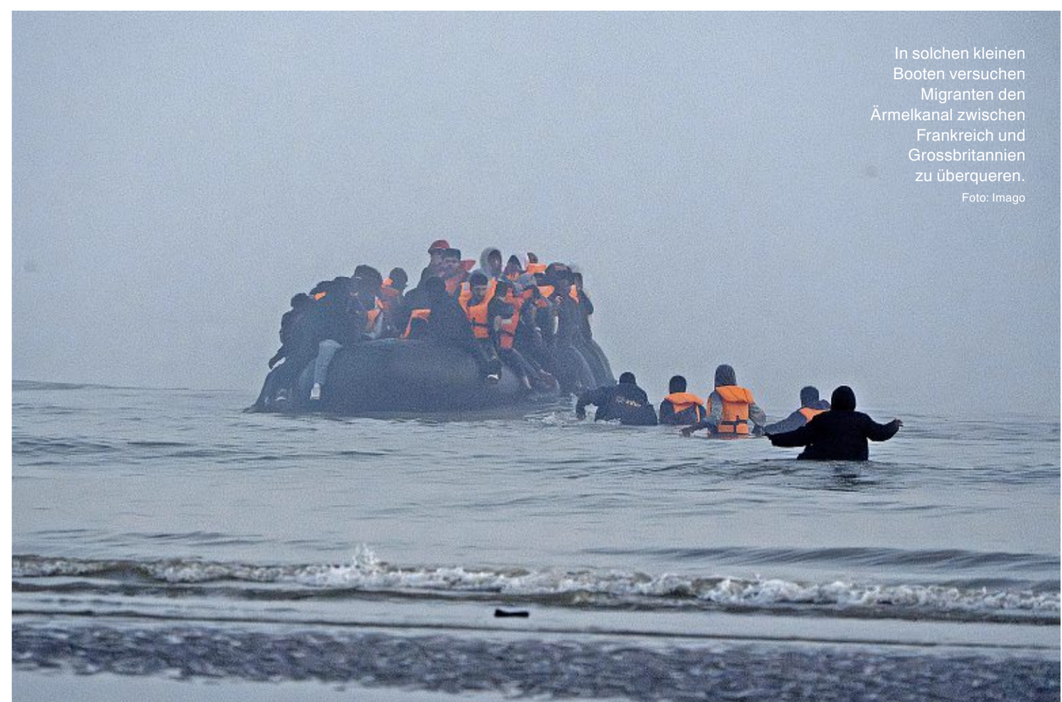
In solchen kleinen Booten versuchen Migranten den Ärmelkanal zwischen Frankreich und Grossbritannien zu überqueren.

Der Brexit befeuert hierzulande die Debatte über die 10-Millionen-Initiative. «Das Beispiel zeigt, dass eine Kündigung der Personenfreizügigkeit grosse