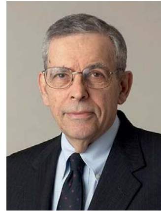
Prof. Dr. Philip Leder Ehrendoktor der Medizinischen Fakultät.